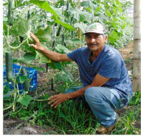
Cultivo orgánico de pepino. El Salvador.