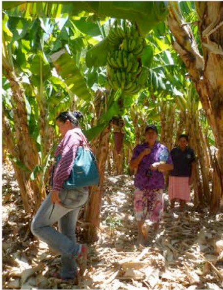
Mujeres en un bananal. Bolivia.