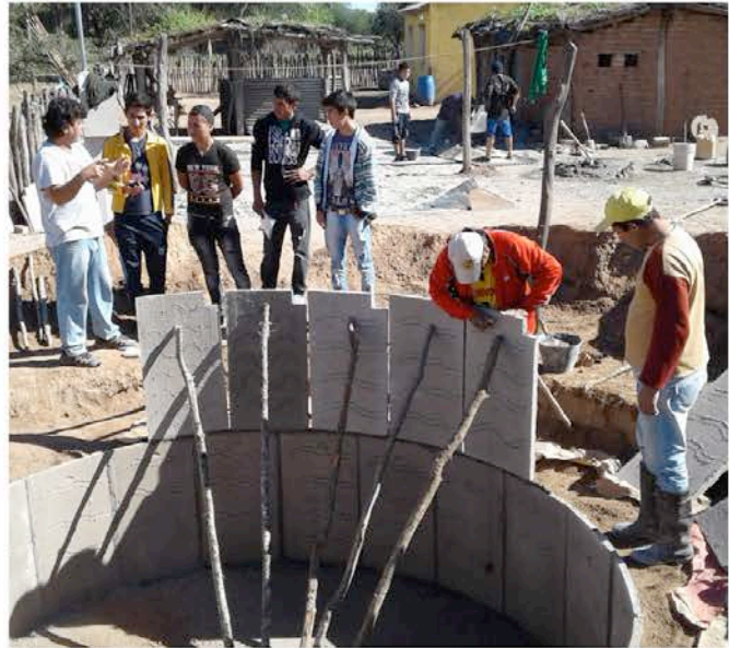
Construcción de cisterna para cosecha de agua. Argentina.