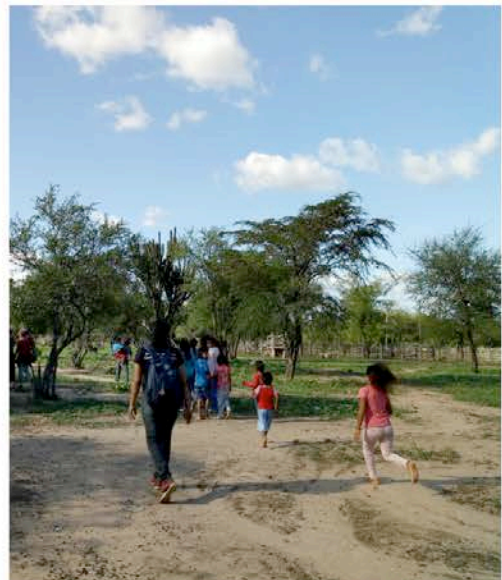
Comunidad wichi. Chaco salteño. Argentina.