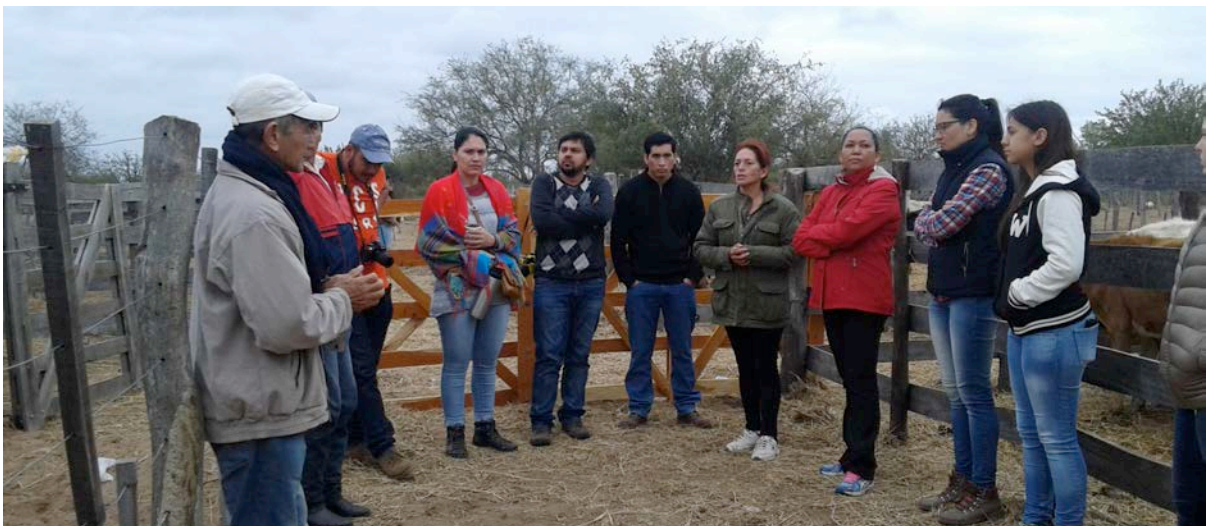
Encuentros de intercambios de conocimientos realizados en Salta, Argentina, 2016.