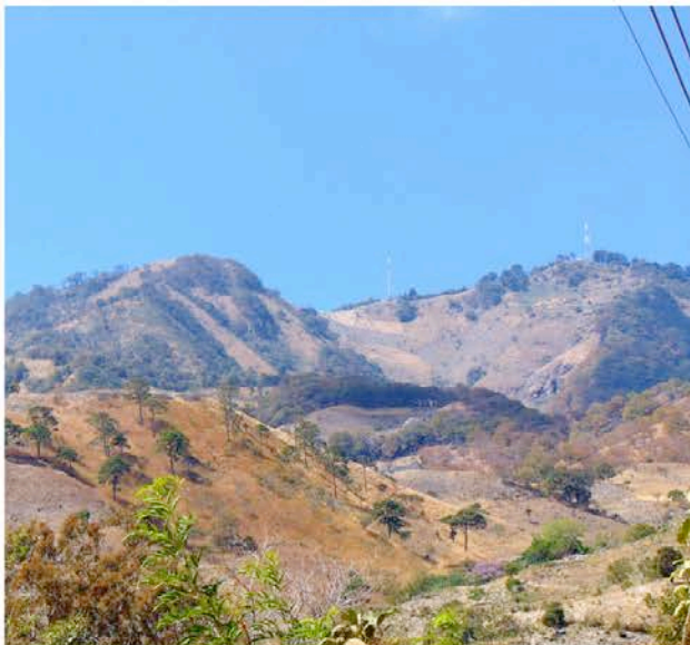
Paisaje semiárido. El Salvador.