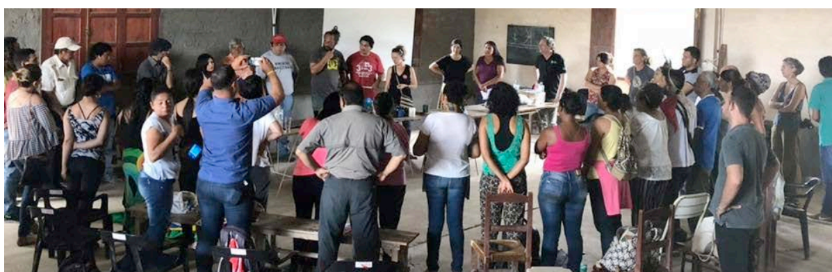
Reuniones de intercambio que se hicieron en la Argentina en 2018.