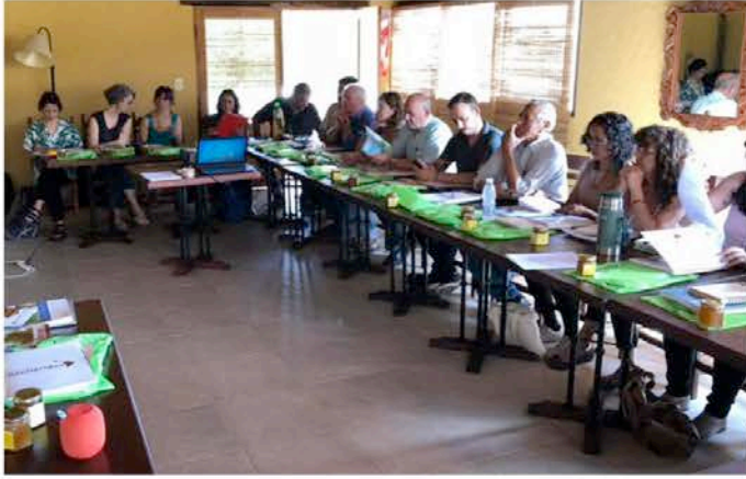
Reunión de trabajo de la Plataforma. Argentina, 2018